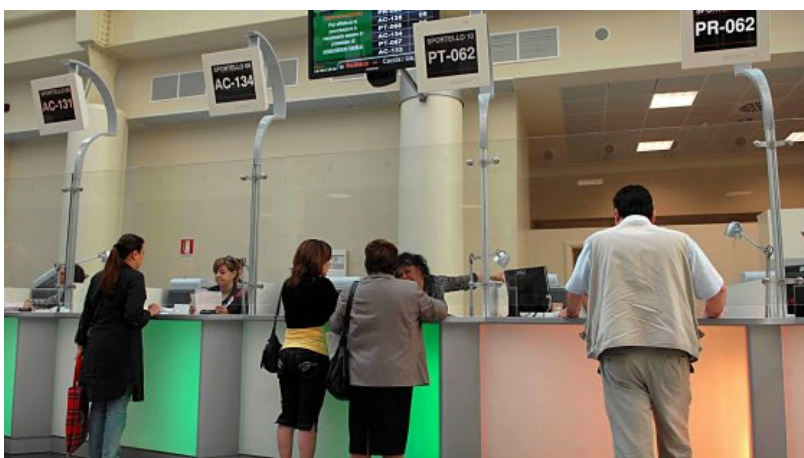
Code agli sportelli dell'Asl per il pagamento dei ticket

Evasione fiscale nella sanità: stimati due miliardi di danni. "Ricette per i familiari e mancati controlli"